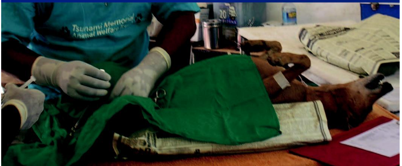
斯里兰卡实行绝育政策

对雌性动物进行绝育的成本高于雄性，不过这样做的好处是能够降低子宫积脓（即子宫感染）发生的风险。雌性动物不会发情怀孕，因此可提高被领养的概率。