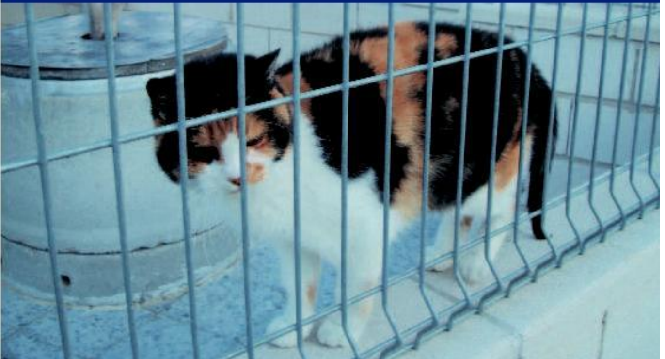
位于马德里一个动物中心的猫舍