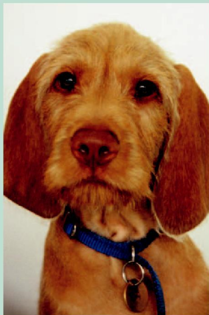
上图：匈牙利硬毛维兹拉犬