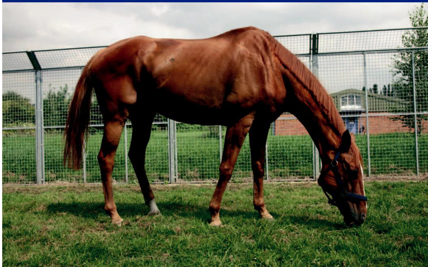
RSPCA动物中心的一匹马

大多数收容所都会收到除了猫狗之外的其他各种各样的小动物。可以建立一个多功能区域，但要记住，这不是一个专门的单元结构，因此动物停留的时间应尽可能短。为了避免为其他小动物专门提供额外的收容空间，寻找可以临时寄养这些动物的家庭，直到有人领养它们。对于大型动物的寄养，情况也一样。小型动物区需要有合适的食物和设备，例如笼子。