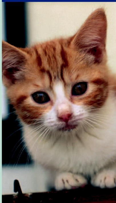
下图：在RSPCA动物中心 的一只小猫