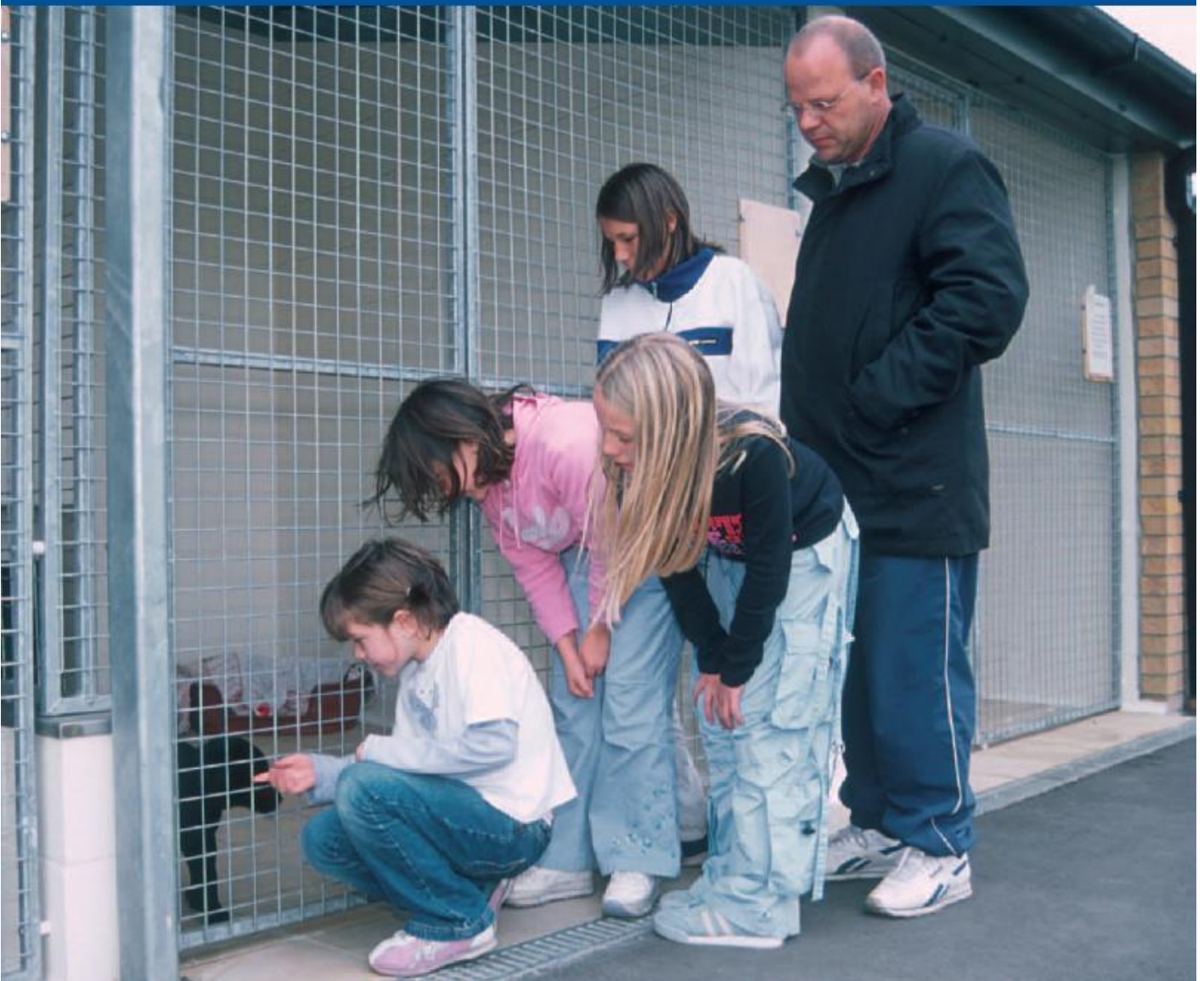
领养家庭在动物中心看望一只等待领养的狗狗