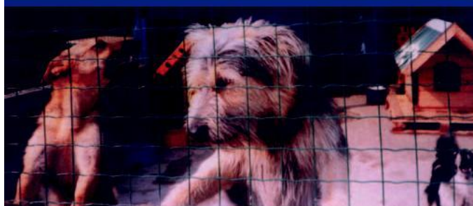
漂亮的犬舍可以提高领养率-- 图为一间波兰收容所