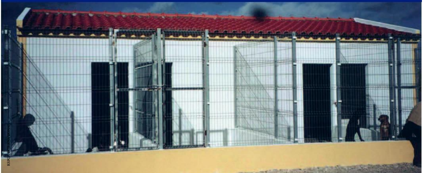
葡萄牙爪哇动物收容所的犬舍